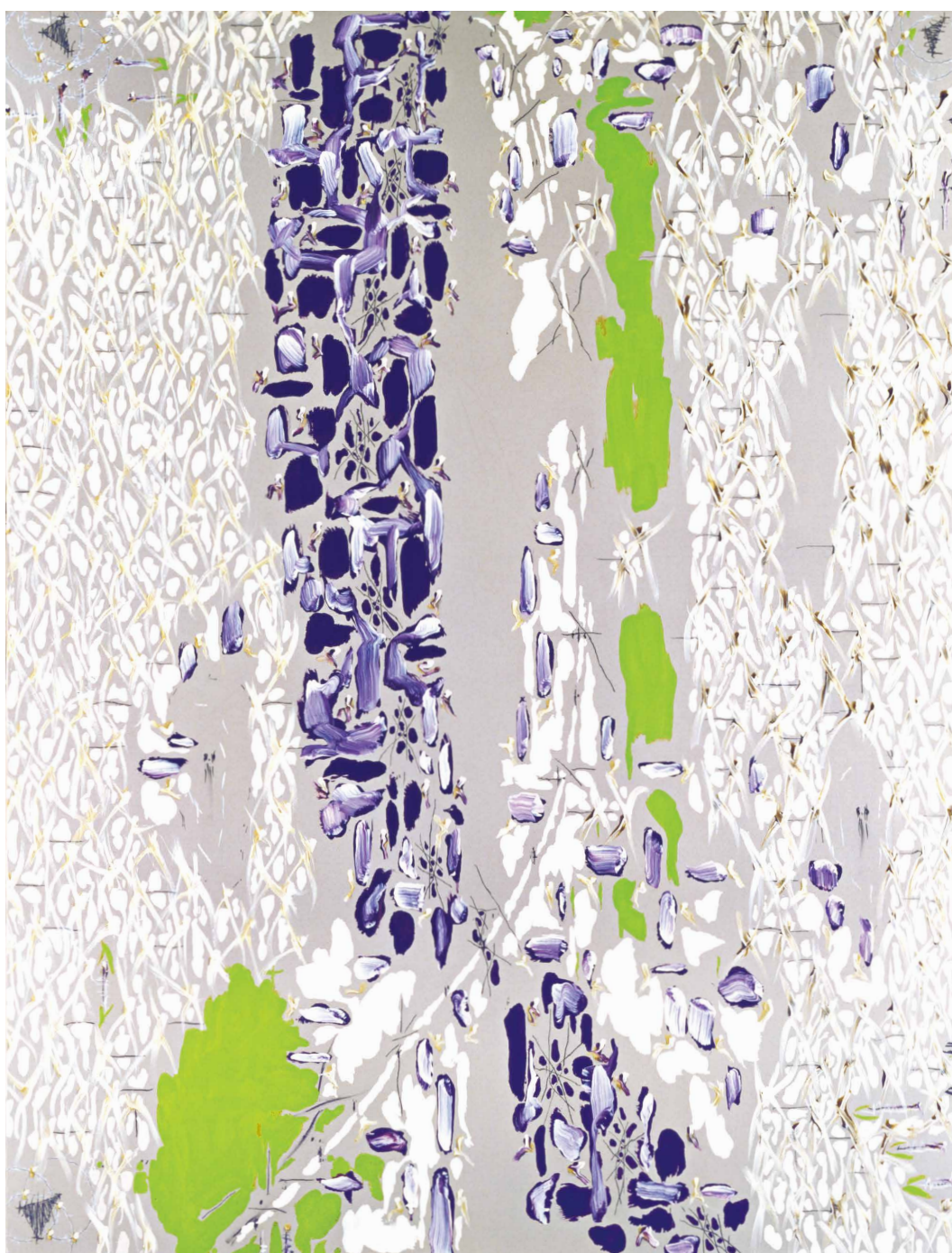
《LOR—目のひびき-III》1988年 和歌山県立近代美術館蔵 ©NATSUYUKI NAKANISHI

協力 SCAN THE BATHHOUSE、山梨交通 助成 公益財団法人ポーラ美術振興財団