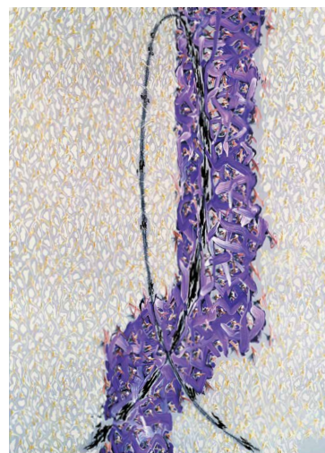
1. 山梨県大月市のアトリエで制作する中西夏之、2002年 撮影：石川裕 写真提供：愛知県美術館／2.《コンパクト・オブジェ》1962年 国立国際美術館蔵 撮影：福永一夫／3.《作品一たとえば波打ち際にて VIII》1984年 セゾン現代美術館 2-3 ©NATSUYUKI NAKANISHI