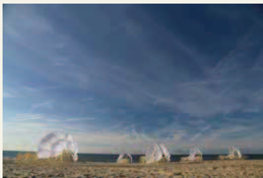
《アニマリス・ウツナミ》2017年 ブルハム期