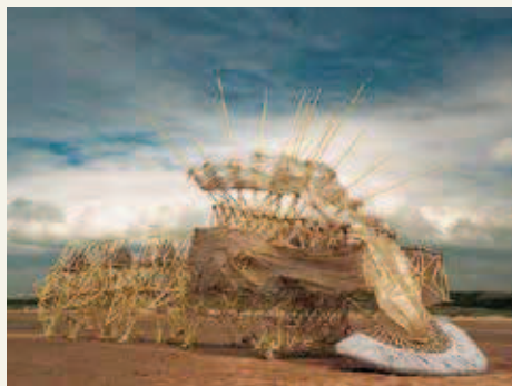
《アニマリス・ヘルシビエーレ・プリムス》2006年 セレブラム期