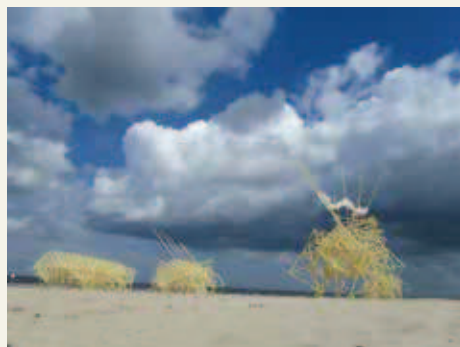
《アニマリス・アデュラリ》2012年 アスベルソリウム期