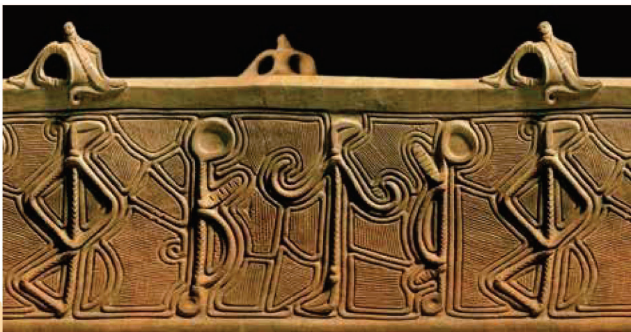
1.重要文化財《人体土器(山梨県立考古博物館蔵)展開写真》| 2.重要文化財《水煙文土器》釈迦堂遺跡博物館蔵(展示期間:10月12日~23日)| 3.重要文化財《土偶》南アルプス市教育委員会蔵(展示期間:9月10日~10月10日)| 4.《土偶》韮崎市教育委員会蔵| 5.山梨県指定《渦巻文土器》笛吹市教育委員会蔵| 6.重要文化財《深鉢形土器》山梨県立考古博物館蔵| 7.《中空土偶》北杜市教育委員会蔵