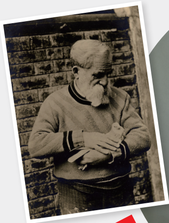
「鳩を抱くポンポン」 写真(撮影年不詳) 群馬県立館林美術館蔵

本展は、最初期の人物彫刻から、洗練された晩年の動物彫刻まで、出身地であるブルゴーニュ地方のディジョン美術館、彫刻と資料を多数所蔵する群馬県立館林美術館等の作品により、ポンポンの作風の変遷と生涯をたどります。動物彫刻の新たな表現を拓いたポンポンの魅力的な作品の数々をご紹介します。