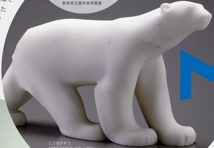
《シロクマ》 1923-1933年 白色大理石 群馬県立館林美術館蔵