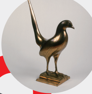
《錦鶏(キンケイ)》 1933年 磨かれたブロンズ ディジョン美術館蔵 (パリ、国立自然史博物館より寄託)