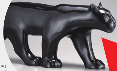
《大黒豹》 1930-1931年 ブロンズ 群馬県立館林美術館蔵