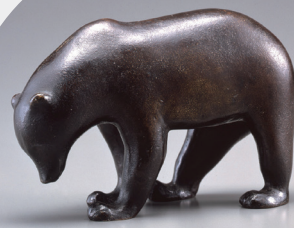
《ヒグマ》 1918-1926年 ブロンズ 群馬県立館林美術館蔵