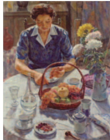
桑原福保《画室の朝》1949年

For 45 years, we at the Yamanashi Prefectural Museum of Art have been growing the foundation of our institution: the collection. In this exhibition, we will show selected works from our collection alongside documents from our archive, while also holding various events inside the gallery. By "remixing" our collection with various ways of seeing, we will explore what is possible for our museum in the decades to come.