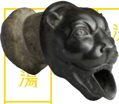
《ライオン頭形の吐水口》1世紀 ナポリ国立考古学博物館蔵