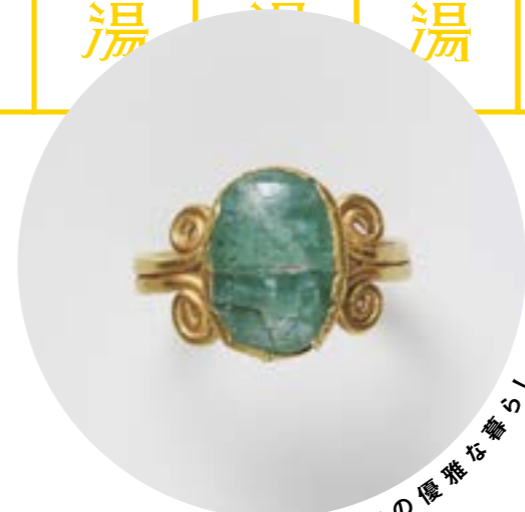
《金製指輪》 1世紀 国立西洋美術館蔵