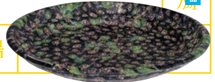
《ミルフィオリ(千花文)皿》 前1-後1世紀 平山郁夫シルクロード美術館蔵