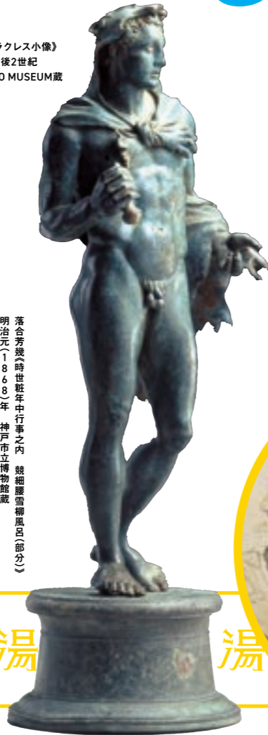
《ヘラクレス小像》 前1-後2世紀 MIHO MUSEUM蔵