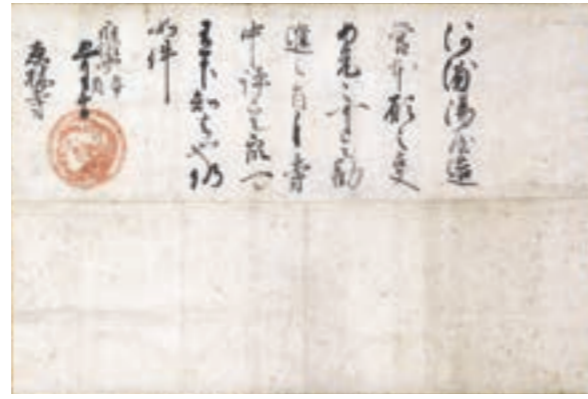
《河浦湯屋遺宮下知状》永禄4(1561)年 恵林寺蔵(信玄公宝物館保管・展示) ※展示期間：9月9日(土)～10月9日(月・祝)