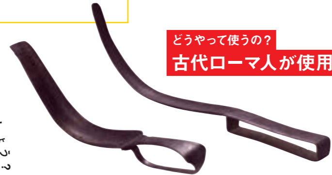
《銅製垢すりへら》前3-前1世紀 ポーラ文化研究所蔵