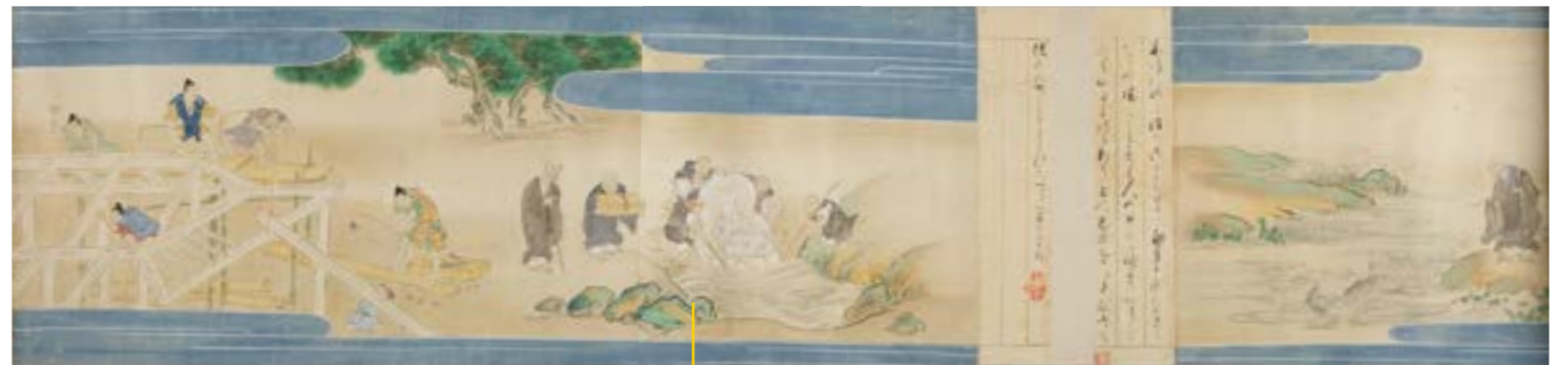
内藤喜昌《有馬温泉寺縁起絵巻(部分)》 江戸時代 兵庫県立歴史博物館蔵 ※会期中場面替えあり