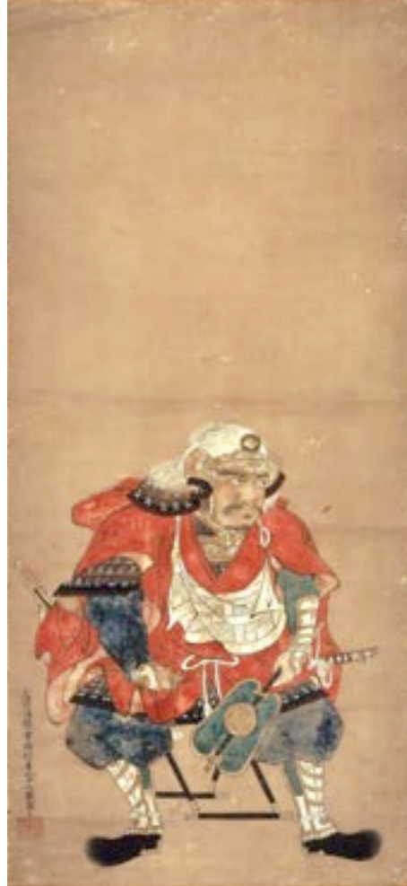
土佐光起《武田信玄像》 江戸時代 山梨県立博物館蔵 ※展示期間：9月9日(土)～10月9日(月・祝)