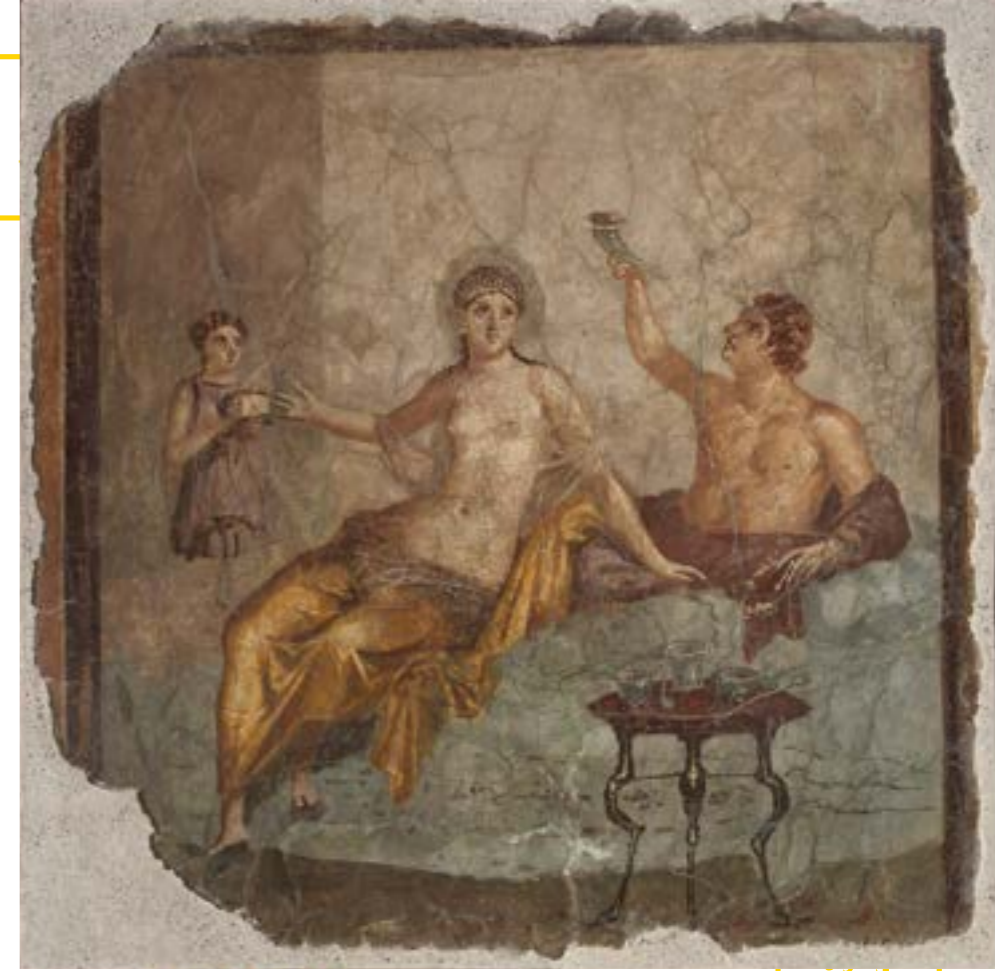
《ヘタイラ(遊女)のいる宴宴》 1世紀 ナポリ国立考古学博物館蔵