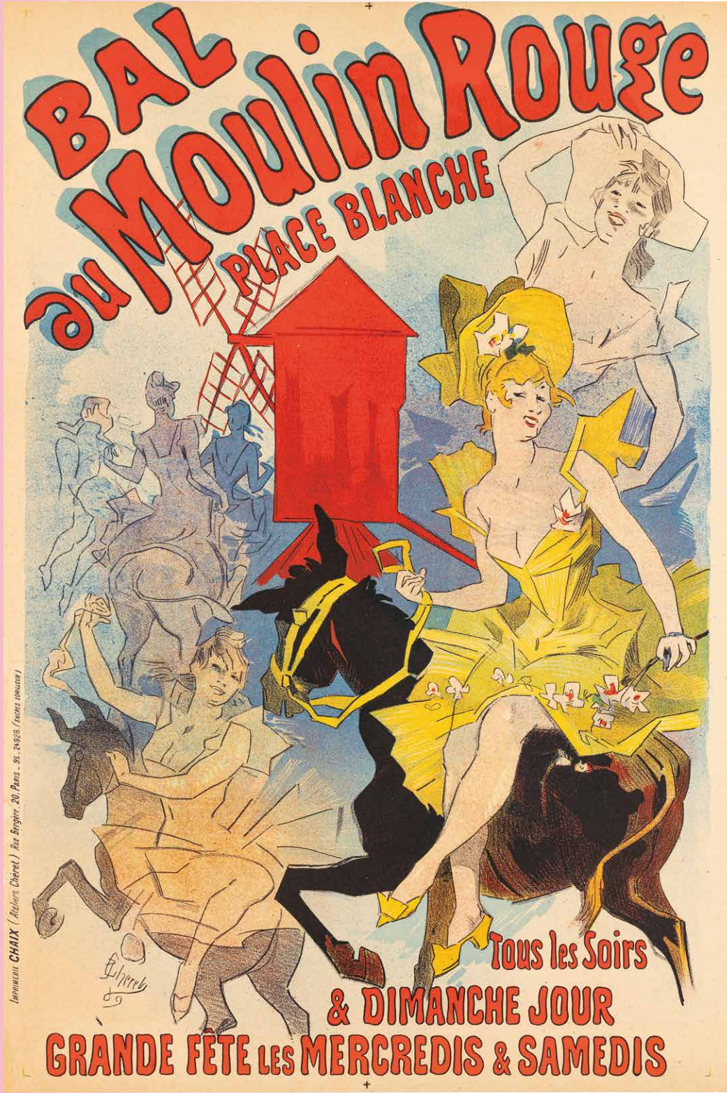
ジュール・シェレ《ムーラン・ルージュ》1889年、デヴィッド・E.ワイズマン&ジャクリヌ・E.マイケル蔵 ©Christopher Fay