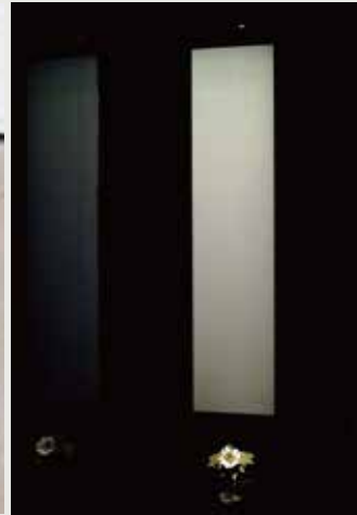
須田悦弘《芙蓉》2012年 千葉市美術館寄託

栗田宏一(1962~)と須田悦弘(1969~)は、日本での数多くの発表に加え、国際的にも活躍している現代アーティストであり、ともに山梨県笛吹市の出身です。栗田は、自ら訪ね歩いた地で一握りの土を採集し、それを展示するという手法をとります。須田は、朴の木を削り彩色した植物の彫刻を、空間にさまざまなかたちで展示するインスタレーションを展開しています。