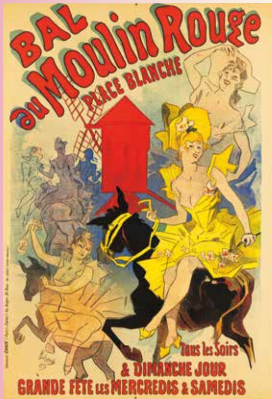
ジュール・シェレ《ムーラン・ルージュ》1889年 デイヴィッド・E.ワイズマン&ジャクリヌ・E.マイケル蔵