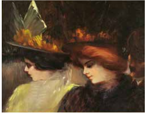
ジョージ・ラクス《通りの情景》1900年頃 デイヴィッド・E.ワイズマン&ジャクリヌ・E.マイケル蔵

Participation fee is free, however exhibition ticket is necessary for entry into galleries.