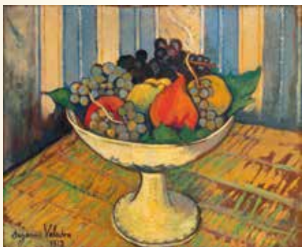
シュザンヌ・ヴァラドン《フルーツ鉢》1917年 デイヴィッド・E.ワイズマン&ジャクリヌ・E.マイケル蔵 ©Christopher Fay