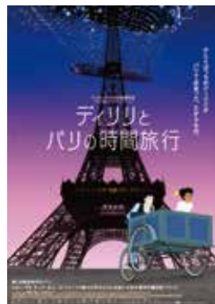
「ディリリとパリの時間旅行」

ニューカレドニアからやって来た少女ディリリが、ベル・エポック期のパリで少女誘拐事件を解決するアニメーション映画。特別展「ベル・エポックー美しき時代」関連上映。(音声:フランス語/字幕:日本語)